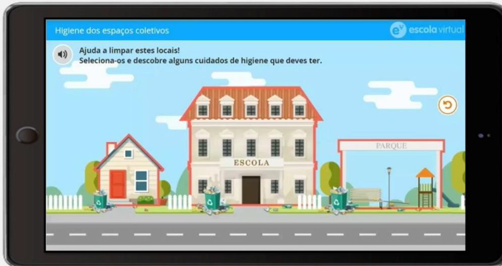
Higiene dos espaços coletivos - Escola Virtual