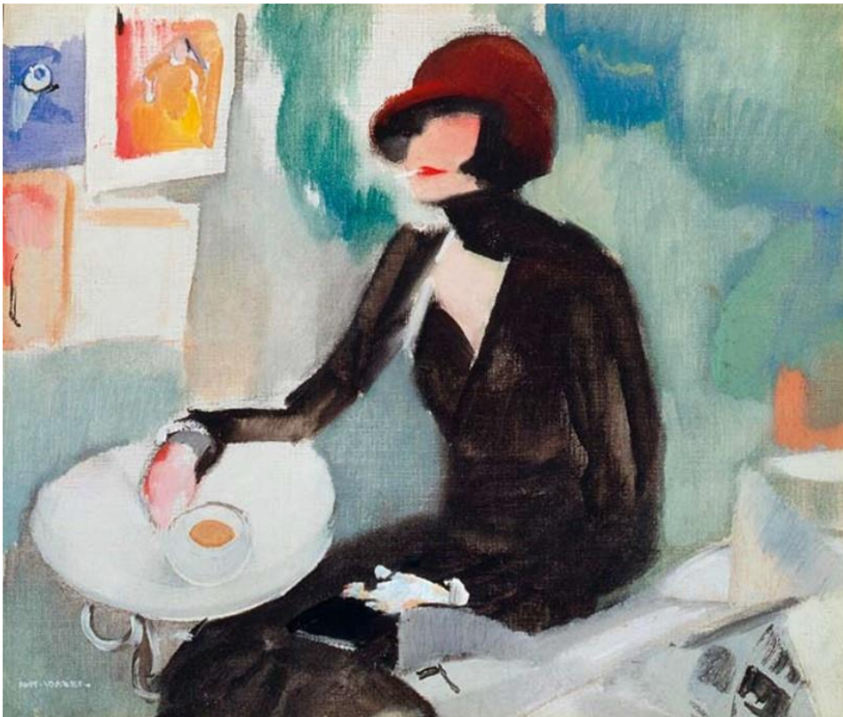
António Soares No terrasse do café des Plaires 1920-30