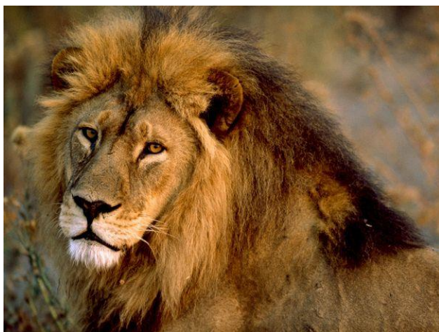
Chris Johns Leão Africano animals.nationalgeographic.com